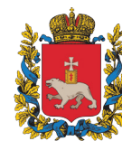
ПЕРМСКИЙ ЦЕНТР РАЗВИТИЯ ДОБРОВОЛЬЧЕСТВА